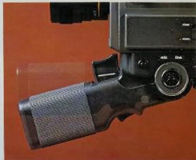
– Einklappbarer Handgriff