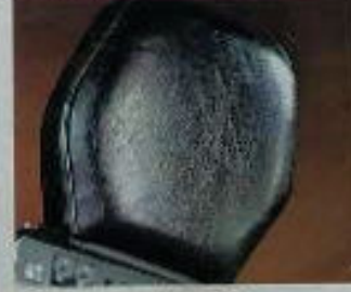
Blimp für 60 m-Kassette

Technische Änderungen des beschriebenen Modells vorbehalten.